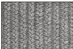
DE 01 Argento Magnetico