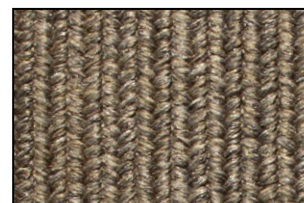
DE 05 Marrone Gea