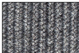
DE 04 Grigio Lava