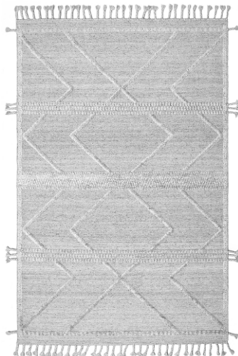
CLN 6197 Argento/Grigio