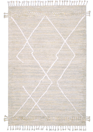
CLN 6200 Giallo/Grigio