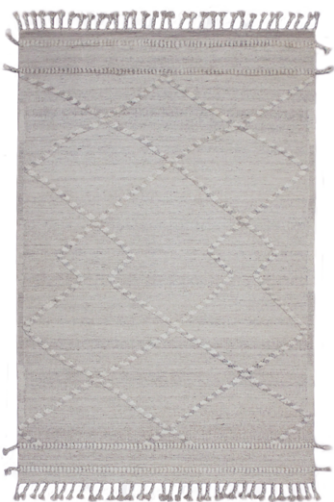
CLN 6194 Avorio/Grigio Chiaro