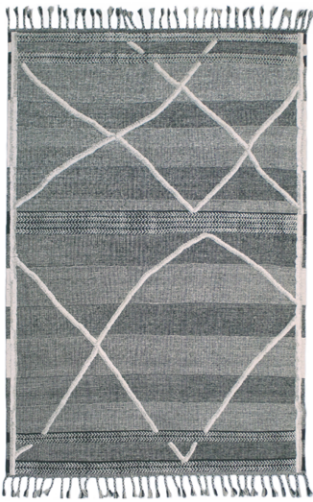
CLN 5014 Nero/Bianco

Disponibile su misura Custom sizes available