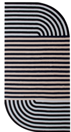
RB 04 - Madame C