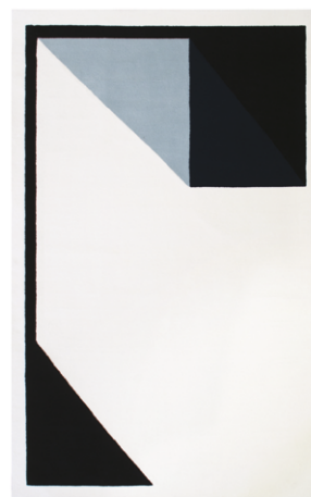
RB 03 - Cabine