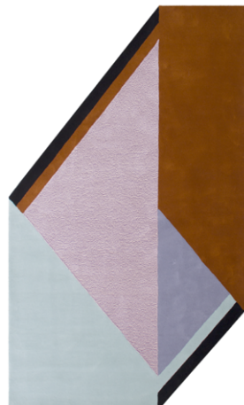
RB 02 - Trofeo