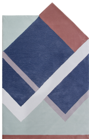
RB 01 - Line Up