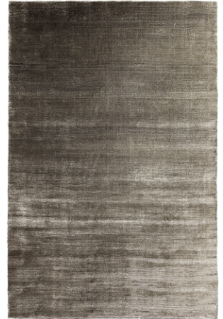
SE 135 Terra