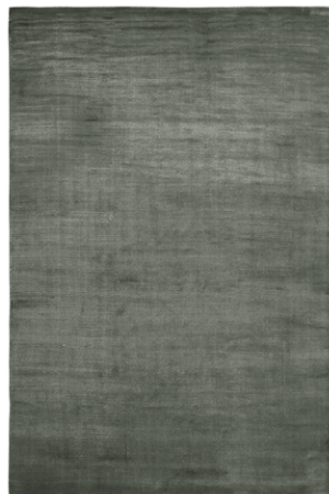
SE 332 Acqua