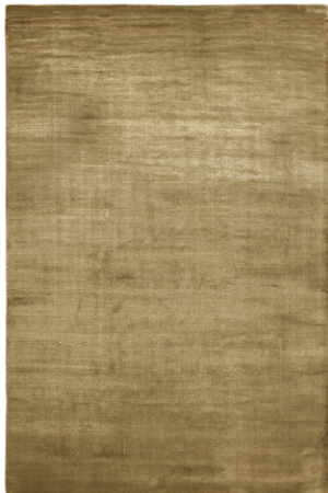
SE 004 Oro

Disponibile su misura Custom sizes available