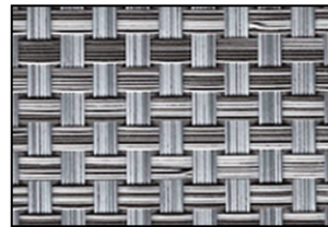
WK 05 Grigio Chiaro/Scuuro