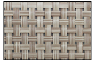
WK 06 Beige/Corda