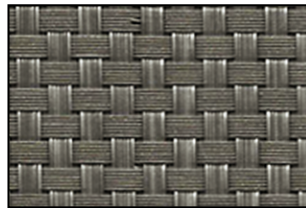
WK 02 Bronzo Antico