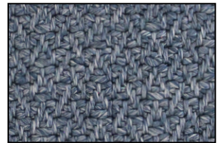
PT 04 Blu Oceano