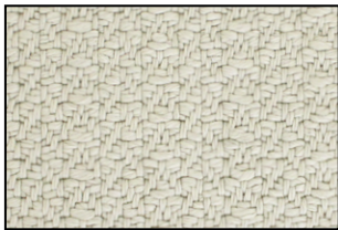
PT 01 Argento Rugiada