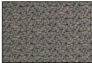
PT 02 Absolute Fango